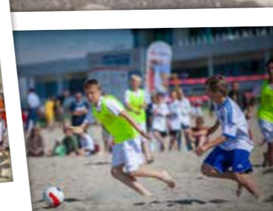
25. bis 26. Juli Beachsoccer Rostocker Robben