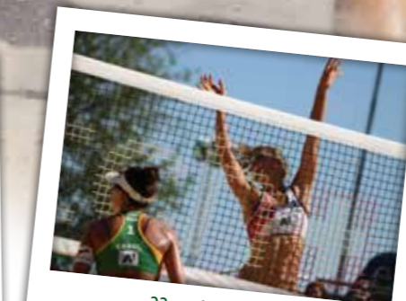
22. und 23. August Endrunde Beachvolleyball M-V