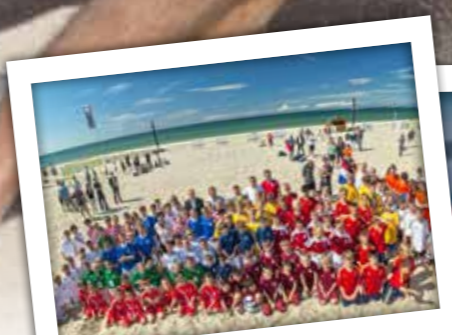
09. Juli Kids-Beachsoccer-Turnier