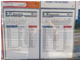
Bushaltestelle Markgrafeneheide (Linie 17 und 18)