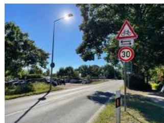
Hinweisschild an Warnemünder Straße beim Startpunkt des Weges (Überqueren der Hauptstraße)