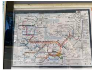
Bushaltestelle Markgrafeneheide (Linie 17 und 18)