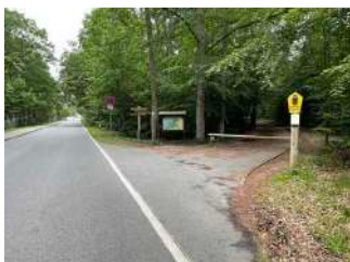
Endpunkt Radweg Abschnitt 1