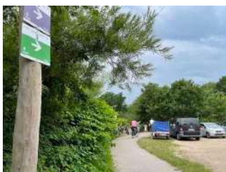
Wegezeichen Thalasso-Kurweg 3