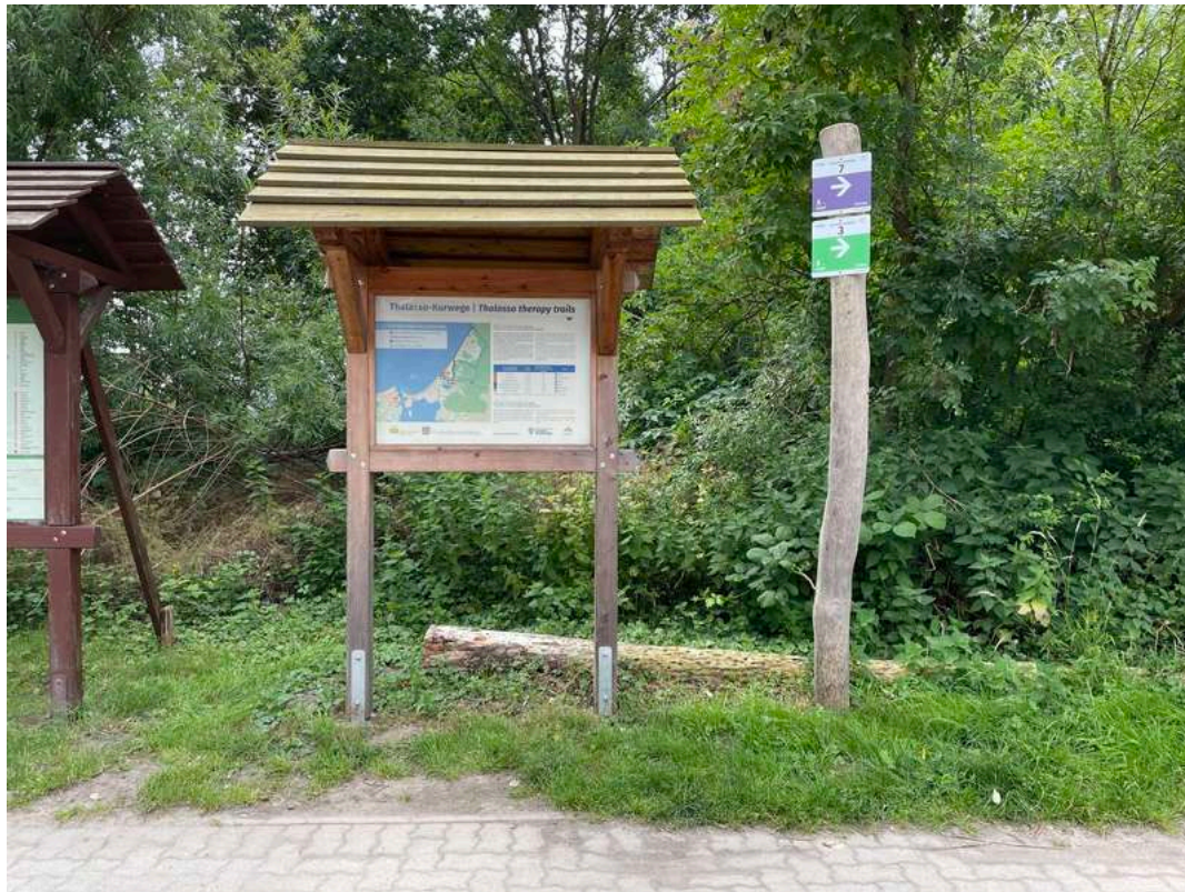
Barrierefreier Thalasso-Kurweg – Radweg Nr. 3