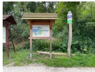
Startpunkt Radweg Abschnitt 1