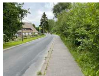
Radweg Abschnitt 1