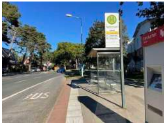
Bushaltestelle Markgrafeneheide (Linie 17 und 18), Warnemünder Straße

Wir haben für Sie einige Fotos aus dem Betrieb / Angebot zusammengestellt. In den Detailberichten finden Sie weitere Fotos.